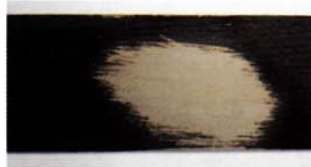
パープルパッド使用