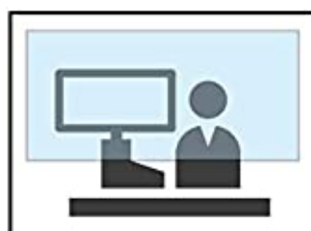
アクリル製 パーティション